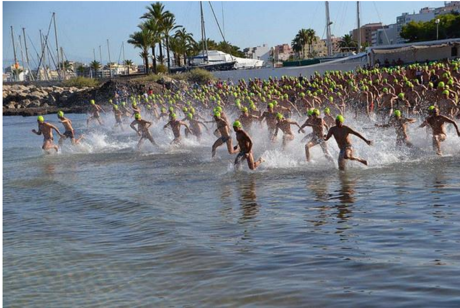
Participantes de la XII Sa Milla 2015

Gracias por participar y disfrutad de esta bonita travesía.