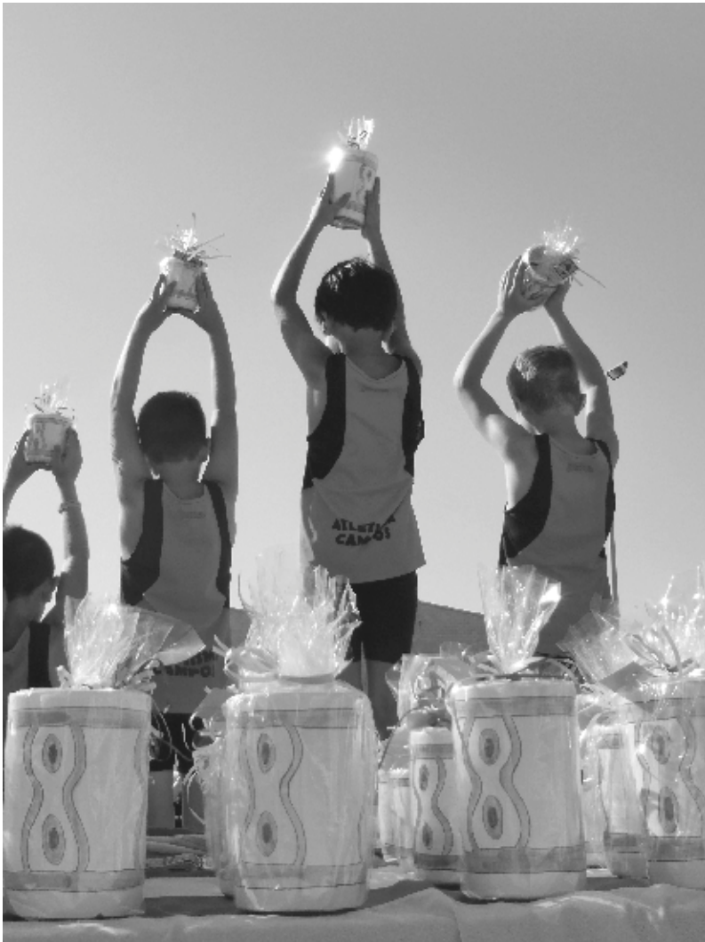
1r Premi del XXXI Concurs Fotogràfic 2015.

Dissabte 7 de maig, al Camp Municipal d'Esports, a partir de les 16:30 h.